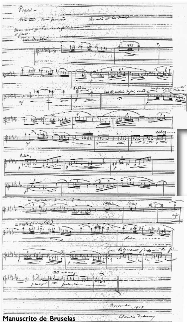
Manuscrito de Bruselas

El insistente poeta recurrió al maestro nuevamente en 1913, esta vez con una proposición que a Debussy se le hizo muy atractiva: una música incidental 5 para un poema dramático en tres actos titulado Psyché . El encargo se refería expresamente a que una música para flauta se incluyera durante la primera escena del tercer acto, como así apareció reflejado en el programa de